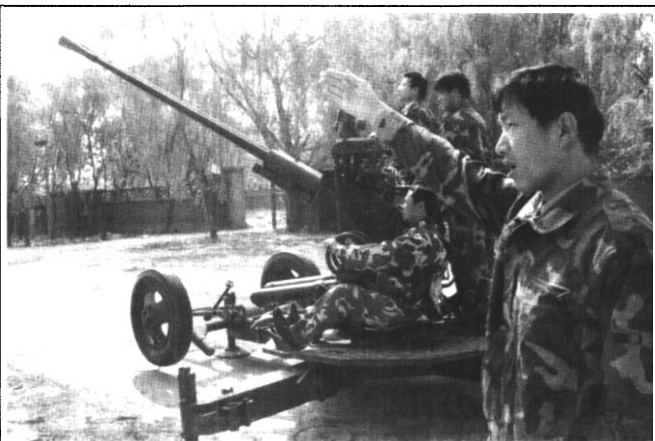
东营区六户镇抽调民兵组建了“防雹增雨作业队”，积极为群众提供“减灾增雨”服务，极大的减少了冰雹等自然灾害对群众生产生活造成的危害，受到了广大群众的普遍欢迎。图为该镇民兵正在进行防雹作业训练。