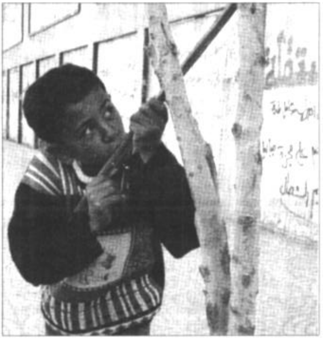
在加沙街头,一名儿童在写满反以标语的巴勒斯坦兵营的围墙外手持木棍做射击动作。持续19个月的以巴暴力冲突给巴勒斯坦的经济社会带来严重影响,孩子们生活在暴力的阴影之下。

张加快发展与部署国家导弹防御系统的步伐,但包括许多民主党议员在内的反对派认为,该系统不仅耗资巨大,而且存在着技术难题。他们指出,“9·11”事件表明,美国面临的主要是非常规威胁,政府不应该把这么多经费用于发展导弹防御系统。