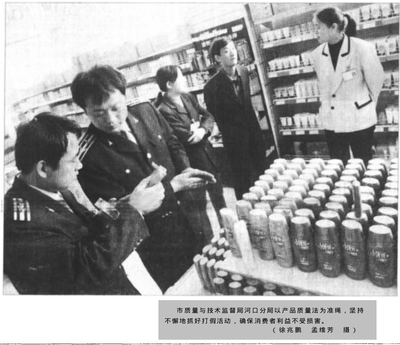
市质量与技术监督局河口分局以产品质量法为准则,坚持不懈地抓好打假活动,确保消费者利益不受损害。