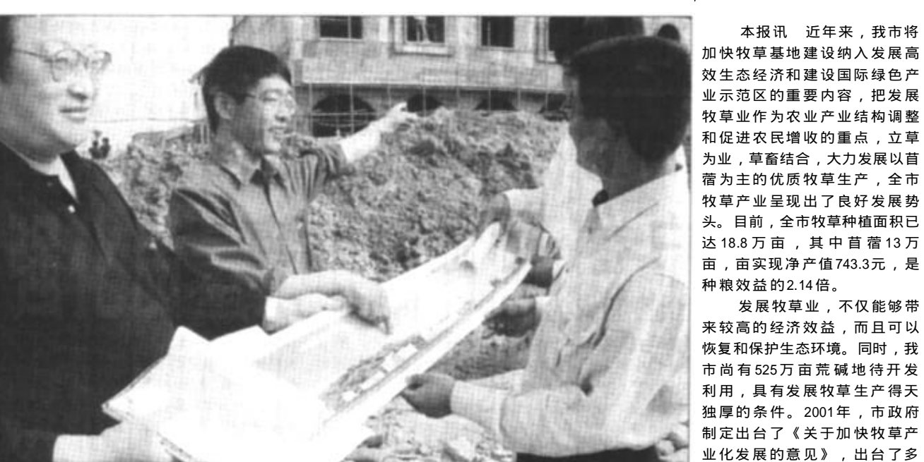
河口区孤岛镇加快小城镇建设步伐，在油、地、军各方的共同努力下，城市的发展突飞猛进，出现了日新月异的喜人景象。图为该镇城建工作人员在新商业街施工现场办公。